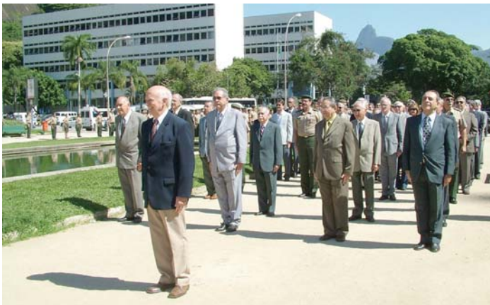
• Desfile de ex-alunos