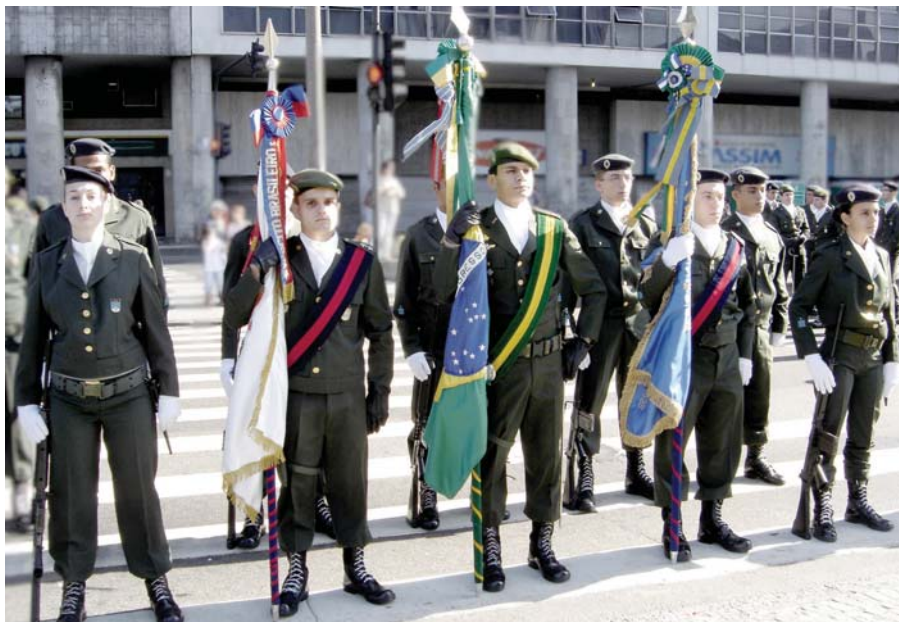
• Guarda à Bandeira do IME no Desfile de 7 de Setembro