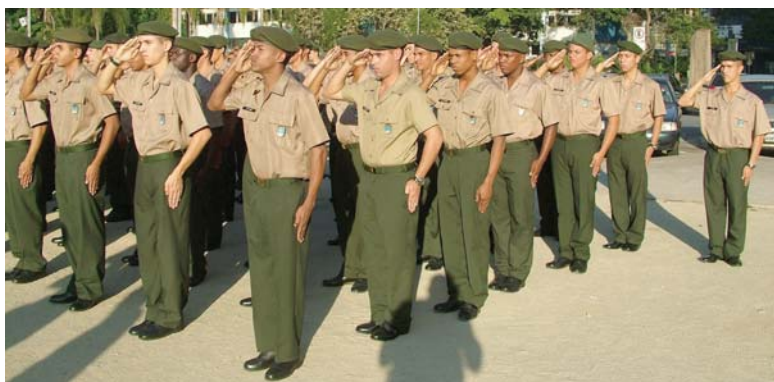
• Grupamento de soldados