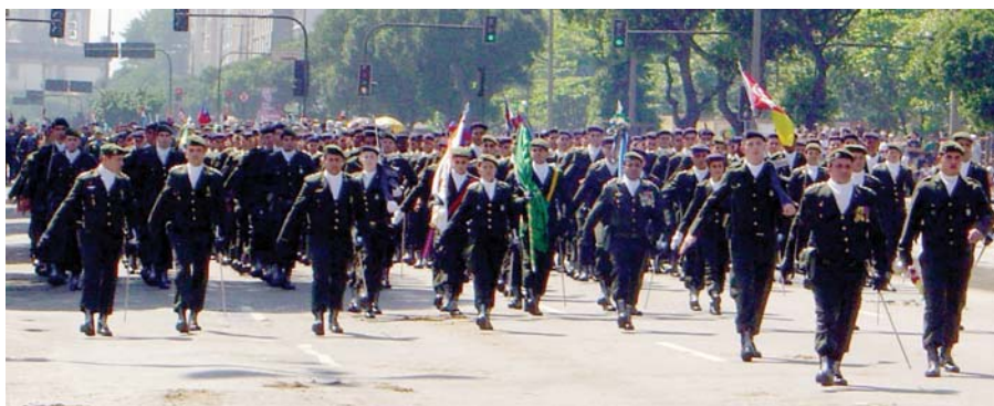
• O IME em marcha na Av. Presidente Vargas