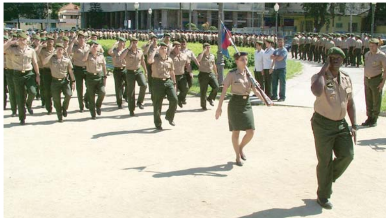
• Desfile do grupamento de alunos

As comemorações de aniversário do IME contaram ainda com os seguintes eventos: