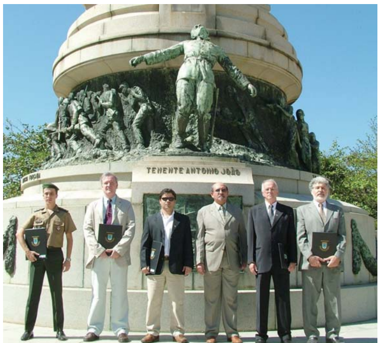
• Amigos do IME homenageados na formatura de 10 Ago 07