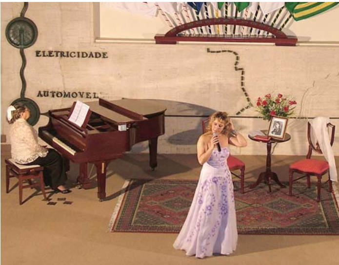
• Apresentação Musical "Um encontro com Chiquinha Gonzaga"