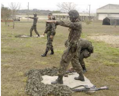
• Flagrante da instrução de granada de mão