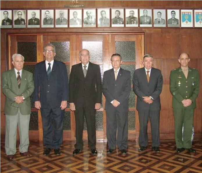
• Reunião e jantar com os antigos Comandantes do IME

Foi comemorado, na semana de 6 a 10 de agosto, o 215º aniversário do Instituto Militar de Engenharia. Na oportunidade, aconteceram os tradicionais eventos que marcam essa significativa ocasião.