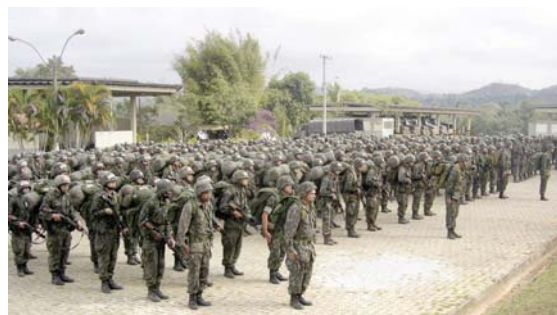
• Formatura por término do exercício. Missão cumprida!