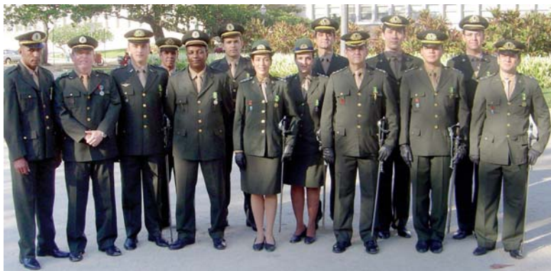
• Militares agraciados