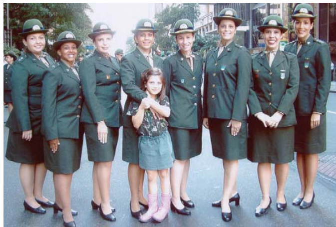
• Oficiais do IME