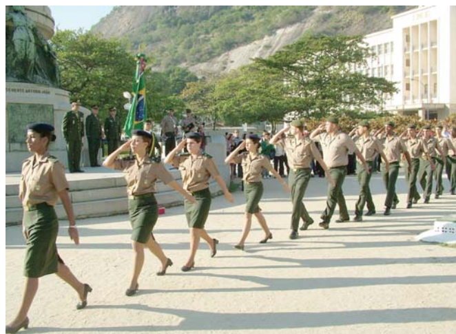
• Desfile dos alunos do 1º ano em continência à Bandeira Nacional