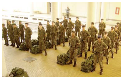
• Formatura antes do embarque para Resende

A atividade contou com a participação de 38 alunos, 4 alunas, 9 oficiais instrutores e 8 praças monitores do IME.