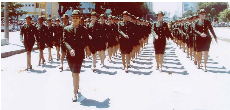
• Grupamento feminino