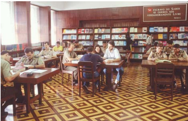
• Biblioteca do IME