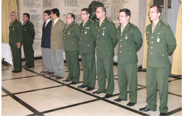
• Apresentação de Oficiais e Professores em cargo de chefia, por ocasião do Jantar dos Antigos Comandantes